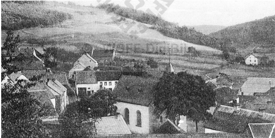
Neroth vor 1930