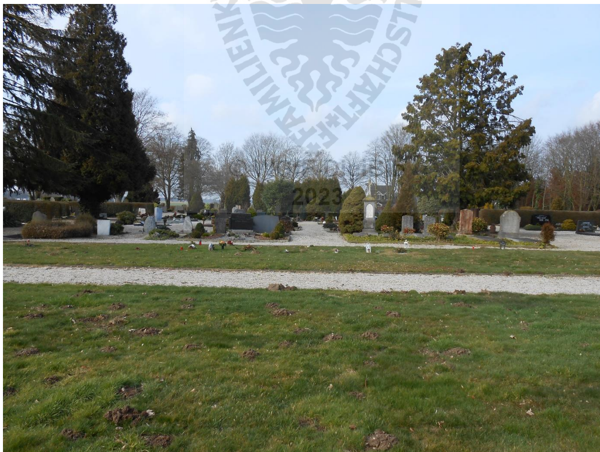
Friedhof der beiden Gemeinden Pfalzdorf West und Pfalzdorf Ost

Am 15. November 1917 übernahm Pfarrer em. Schwarz aus Barmen die Stellung eines Hilfsgeistlichen die Pfarrgemeinde Pfalzdorf Ost. Ende September 1920 schied er aus.