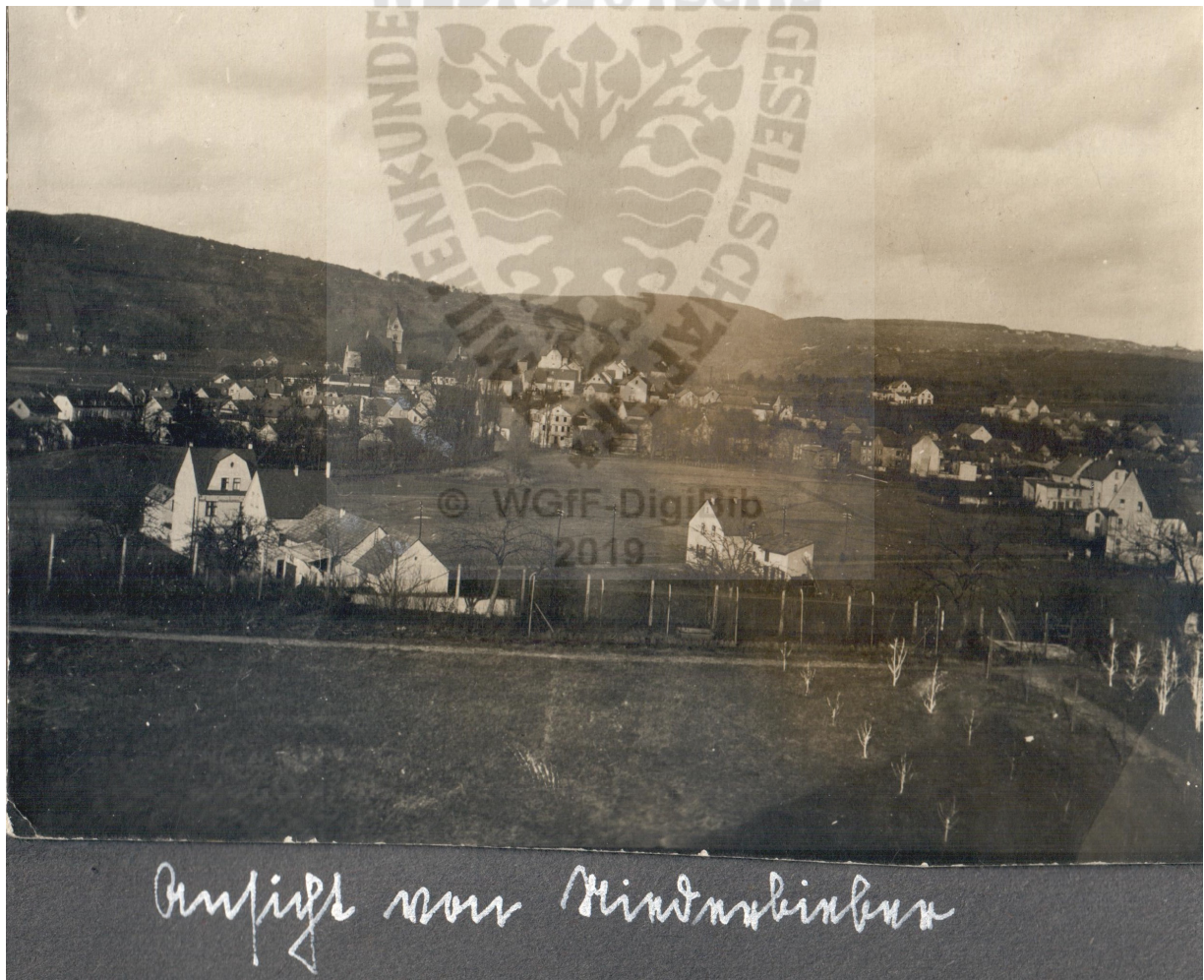
Ansicht von Niederbieber ca. 1930

150 Jahr Bestehen Rasselsteiner Eisenwerks Gesellschaft.